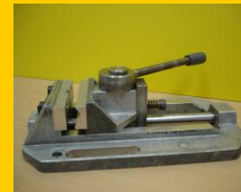
Etau à serrage rapide